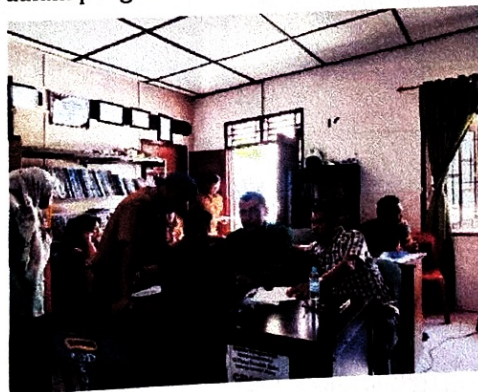
Gambar 3. Proses Penggunaan Komputer

Disini menjelaskan pengertian teknologi komputer fungsi dan Kegunaan sehingga peserta mampu dan paham dengan makna dari literasi digital dalam pengenalan Komputer