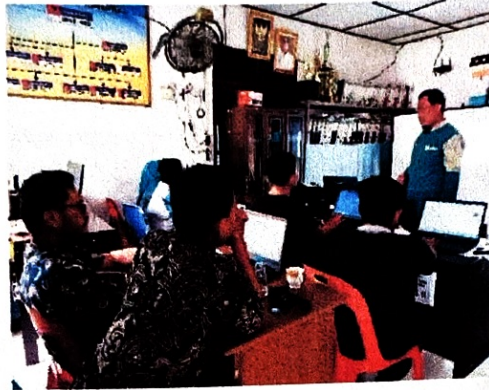
Gambar 2. Dokumentasi Saat memberikan materi dengan peserta pelatihan

Materi yang pertama dijelaskan pada kegiatan pelatihan komputer ini adalah mengenalkan alat serta fungsi dari teknologi komputer itu sendiri. Adapun kegiatan tersebut dapat dilihat pada gambar dibawah ini.