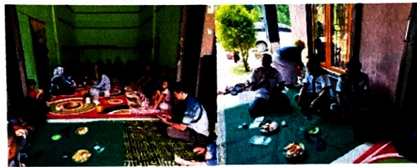
Gambar 2. Dokumentasi Pengenalan Aplikasi

Materi yang pertama dijelaskan pada kegiatan pelatihan digital marketing ini adalah mengenal clasroom sebagai sarana untuk pembelajaran online Adapun kegiatan tersebut dapat dilihat pada gambar 2